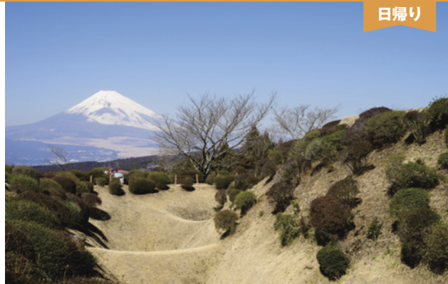
山中城跡より富士山を望む