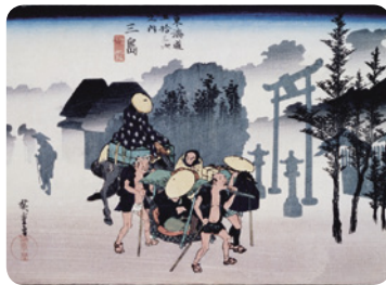
東海道五十三次「三島」歌川広重

「出来る限り旧東海道に沿って西進する」掲げるこの企画では、自動車が通行出来ない箇所は自分の足で歩いて行きます(ただし一部箇所は割愛)。今回は箱根峠から山中城跡を経て「こわめし坂」を下ったところにある三ツ谷新田までの約8kmを歩きます。