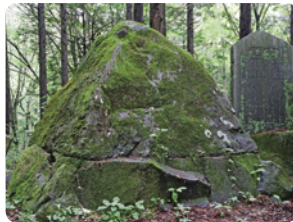
箱根西坂のかぶと石