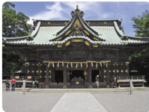
源頼朝をはじめ武門武将が崇敬する三嶋大社