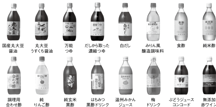
国産丸大豆醤油 丸大豆うすくち醤油 万能つゆ だしから取った濃縮つゆ 白だし みりん風醸造調味料 食酢 純米酢 調理用合わせ酢 純りんご酢 純玄米黒酢 はちみつ黒酢ドリンク 温州みかんジュース 梅ドリンク ぶどうジュースコンコード 無添加赤ワイン